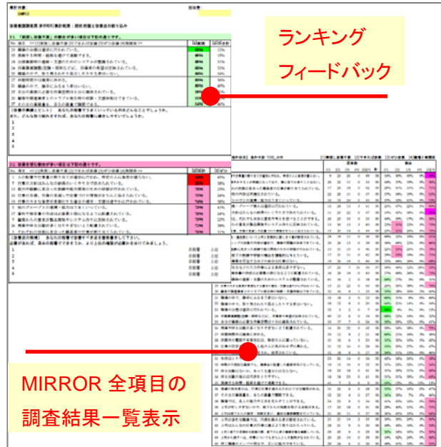
Fig.1: MIRAGe による結果フィードバック(イメージ)

MIRAGe による、MIRROR の調査結果のフィードバックでは、各部署に関する 3 種類の情報が提供される。